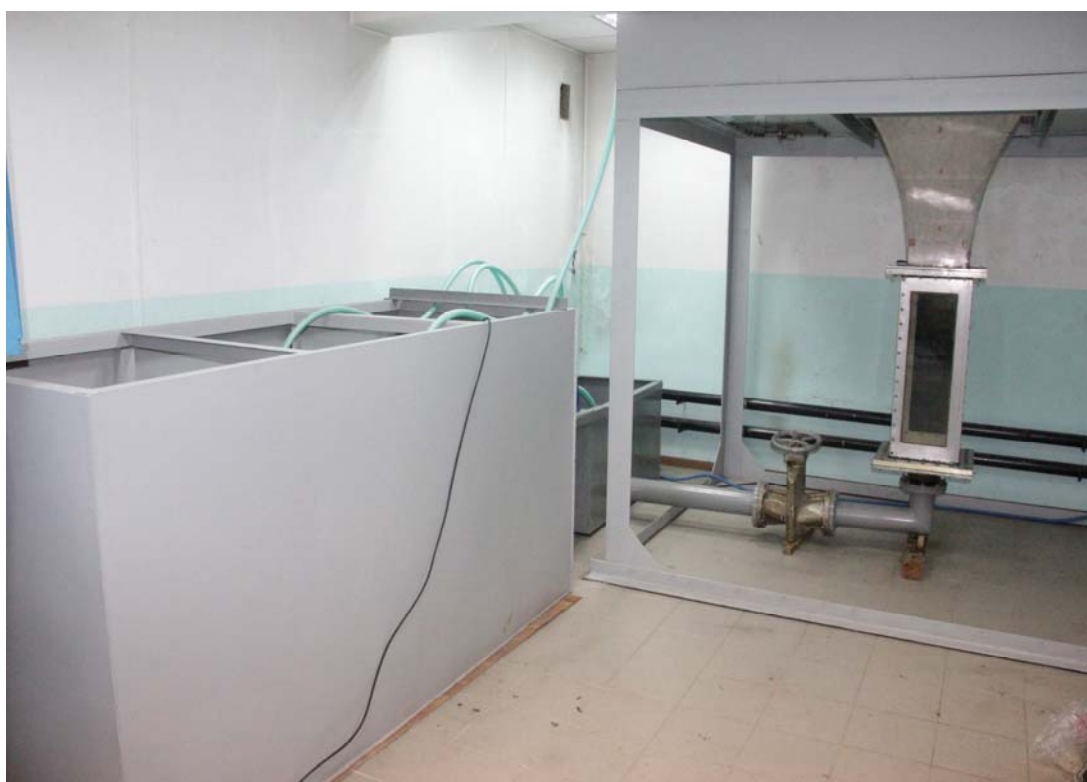
Гидравлическая труба вертикальная