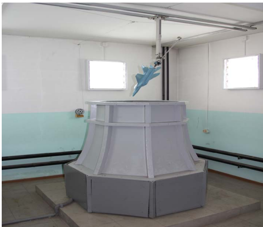
Вертикальная аэродинамическая труба (штопорная труба)