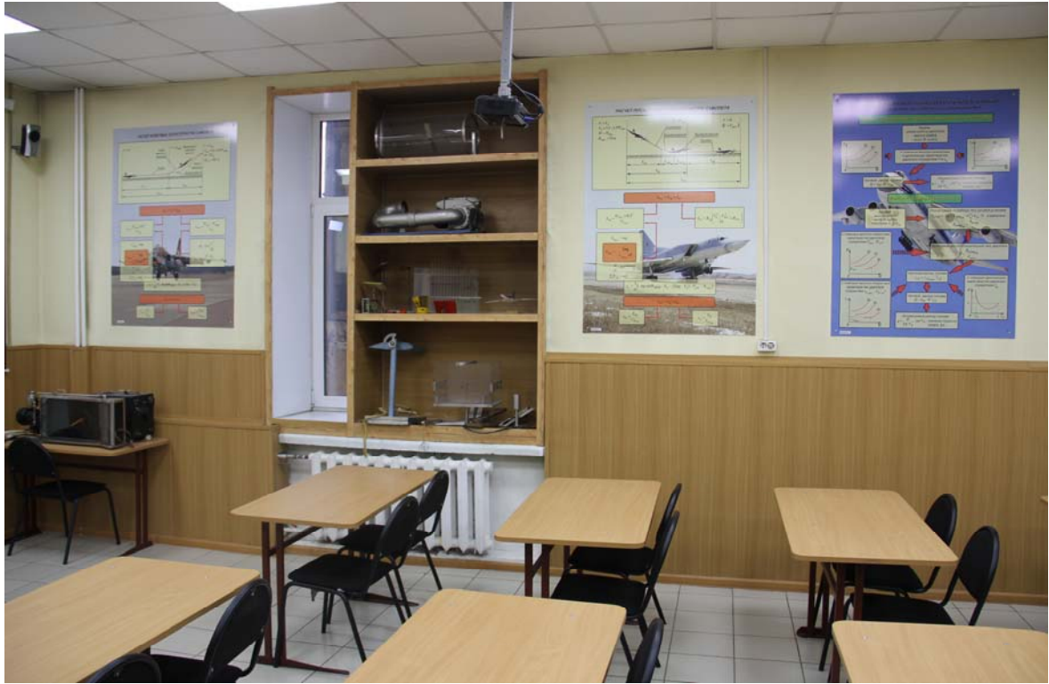
Комплексная лаборатория аэродинамики и динамики полета (аудитория № 212)