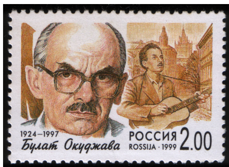
Рисунок 2 – Почтовая марка России из серии «Популярные певцы российской эстрады»